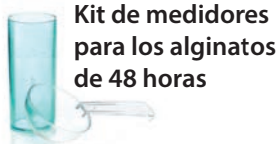
Kit de medidores para los alginatos de 48 horas

Para cada cucharada rasa de polvo añadir 1/3 de la medida de agua.