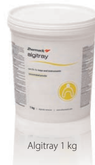
Algitray 1 kg