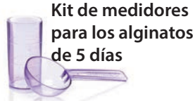
Kit de medidores para los alginatos de 5 días