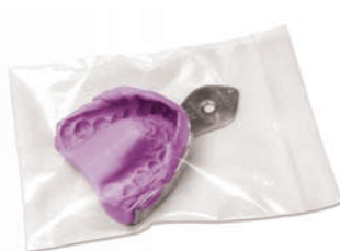
Bolsitas de larga duración, cada envase contiene 100 uds (bolsitas herméticas para conservar las impresiones)