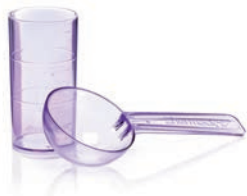
Kit de medidores para alginatos de 5 días