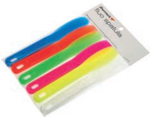
Espátulas de alginato fluorescentes (6 uds)