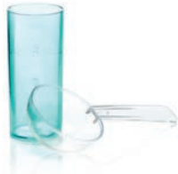
Kit de medidores para alginatos de 48 horas