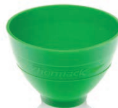
Taza de goma