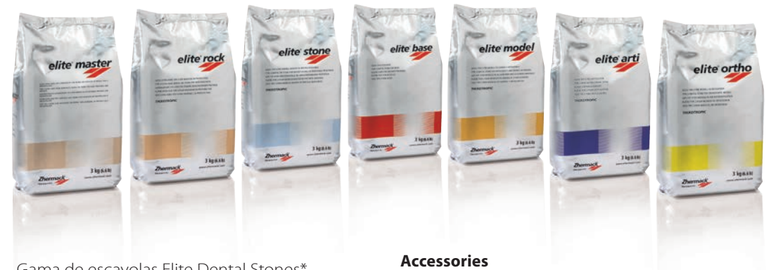
Gama de escayolas Elite Dental Stones*