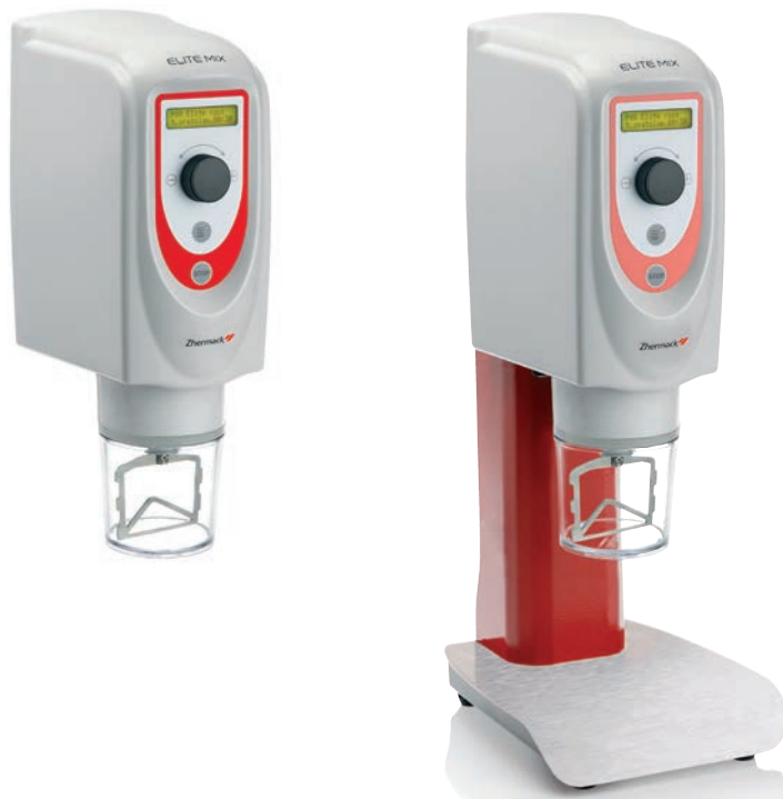
Configuración de mesa con soporte (opcional)